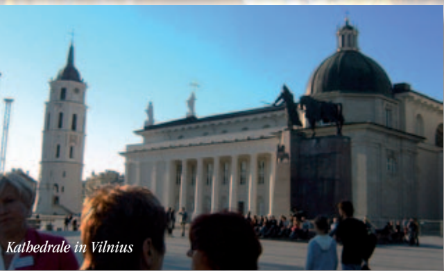
Kathedrale in Vilnius