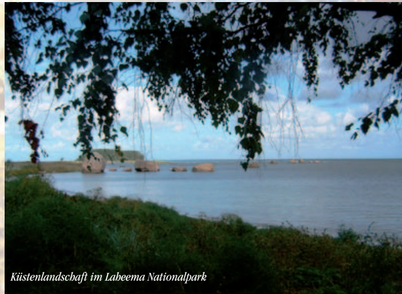
Küstenlandschaft im Labeema Nationalpark