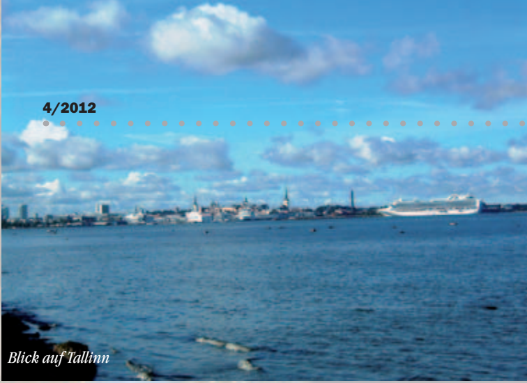
Blick auf Tallinn