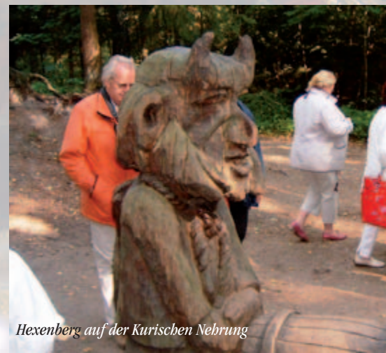
Hexenberg auf der Kurischen Nehrung

Schon zu Beginn der Reise aufs Baltikum und nach St. Petersburg war der Streik der Flugbegleiter ein Thema: es war der erste Tag des Streiks, der zwei Tage später zu erheblichen Beeinträchtigungen führte. Da lagen aber schon mehrere Stationen hinter der -dieses Mal etwas kleineren- Reiseschar. Die schöne Altstadt von Vilnius, der litauischen Hauptstadt, hatte man erbummelt, angereichert mit vielen Informationen durch die sympathische Reiseleiterin, einer Baltikumkennerin mit viel Kompetenz und Humor. Überhaupt spielte der Humor, der Spaß, eine große Rolle auf dieser Reise, man verstand sich prächtig und amüsierte sich entsprechend. Nicht zuletzt bei der Begehung des Hexenbergs auf der Kurischen Nehrung, wo Künstler eine Vielzahl von Holzfiguren aus litauischen Märchen geschaffen haben, deren Mystik zum Mitmachen mit viel Phantasie und Spaß anregen. Und auch der dort einer Holzfigur einzuflüsternde Wunsch einer Mitreisenden ging größtenteils in Erfüllung: Gutes Wetter. So hatte man fast immer trockenes und sonniges Wetter, wenn man im Freien unterwegs war, während es bei den Busfahrten und Innenbesichtigungen auch schon mal regnete. Wünsche konnte man auch an einem anderen Berg äußern, der jedoch eine andere Bedeutung hat: Der „Berg der Kreuze“, eine religiöse Pilgerstätte und Symbol des Widerstands, wo unzählige Kreuze in allen Variationen zu finden sind. Ein beeindruckender Ort!