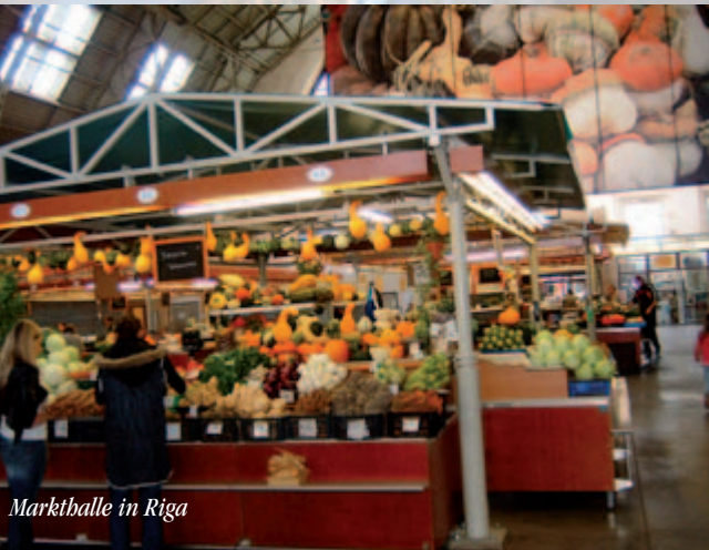
Marktballe in Riga