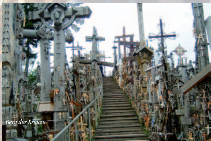
Berg der Kreuze