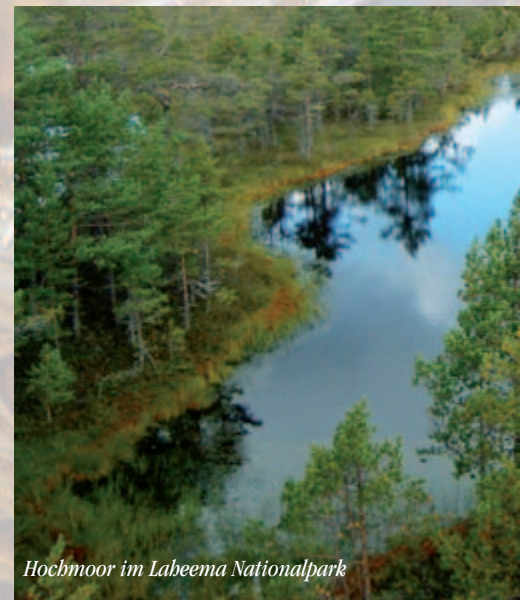
Hochmoor im Labeema Nationalpark