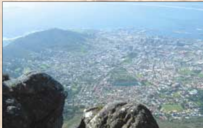
Blick vom Tafelberg auf Kapstadt mit Waterfront

dieses Mal wieder eine bunte Schar von Reisefreunden anlockte. Und sie wurden belohnt: Das Wetter spielte größtenteils mit, die Reiseführerin vor Ort war menschlich und fachlich einfach „klasse“ (entpuppte sich darüber hinaus noch als Hobby-Botanikerin und Weinkennerin), größere Zwischenfälle blieben aus (sieht man einmal vom kurzfristi-