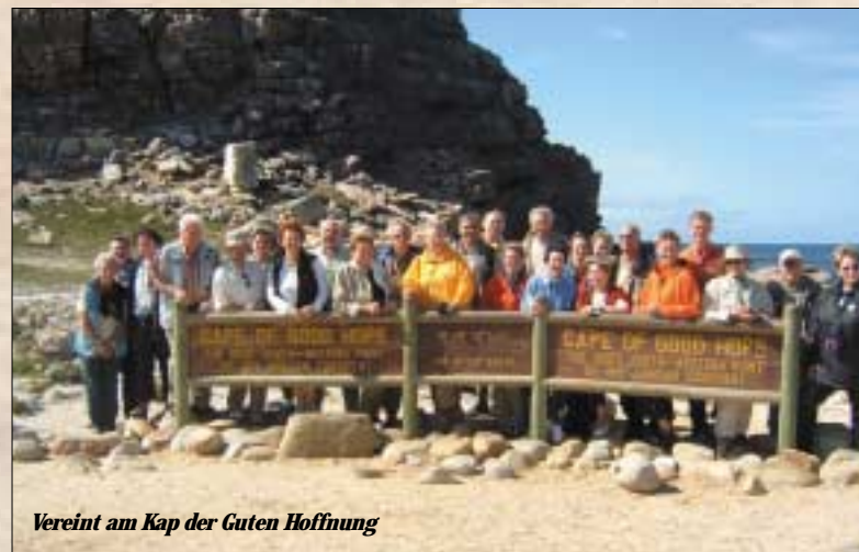
Vereint am Kap der Guten Hoffnung